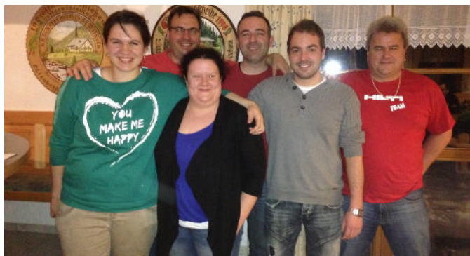
Die Schützen der drei besten Mannschaften

Alle aktuellen Wettkämpfe und Ergebnisse wurden direkt auf Bildschirm und Leinwand ins Vereinsheim übertragen. So konnten sich die Wettkampfteilnehmer und Zuschauer jederzeit über den aktuellen Stand informieren und mit den Vereins- und Firmenkollegen live mitfiebern.