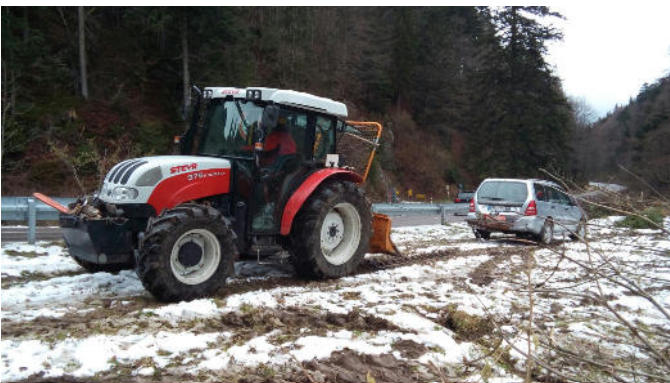
Nicht nur Holz hing am Haken—bei rutschigem Untergrund war Schweres Gerät anderweitig notwendig